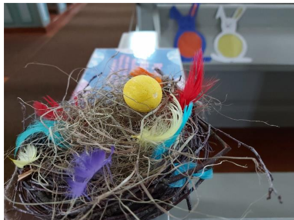
Pitkäperjantain rukouspolkurastit kirkossa. Toimintakeskus Laukkalinnan pääsiäiskoristeet kirkossa.